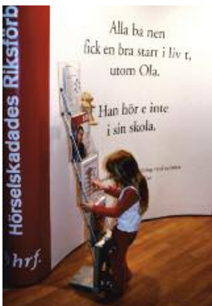
Hundratals föräldrar och barn kom till HRFs öppna möten under turnén.

Och det tog skruv: HRFs skolmodell är nu på väg att bli verklighet. Regeringen tog för-