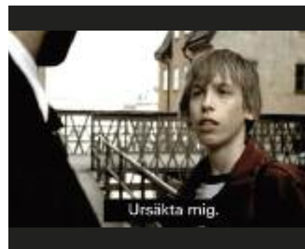
Våren 2007 visades två kortfilmer från HRF i TV4 och TV8 med text via text-tv. Det var första gången en reklamfilm textades.

En fråga som upprör många är störande bakgrundsljud och otydligt tal i radio och tv. Massor av enskilda har hört av sig till SVT och