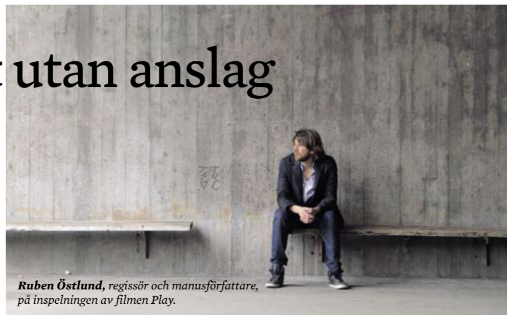
Ruben Östlund , regissör och manusförfattare, på inspelningen av filmen Play .

kan underlätta för publiken att uppfatta dialogen, tillägger han.