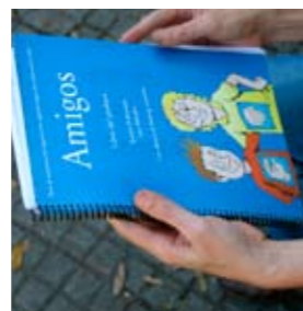
Bristvara. Läroboken togs fram men blev aldrig tryckt.