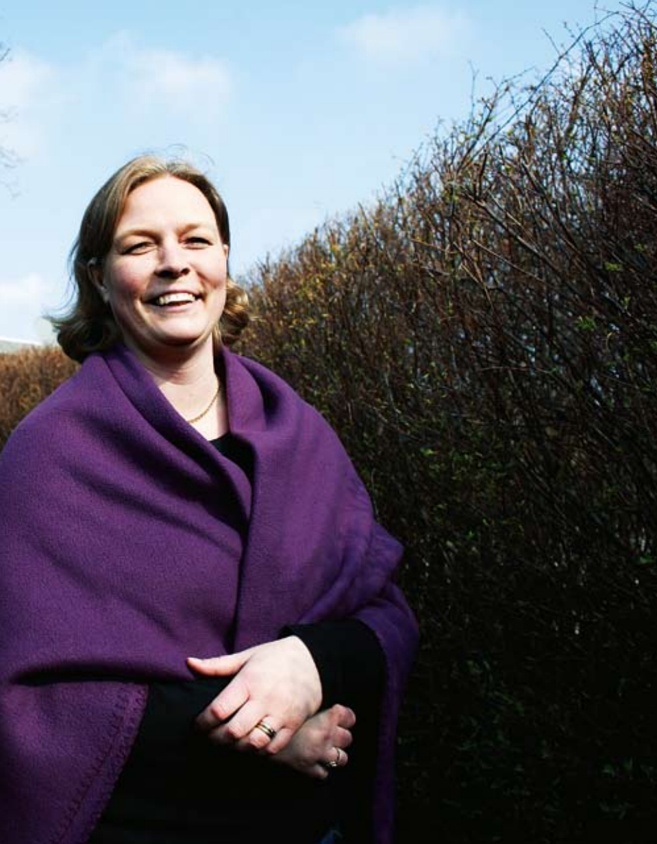
trafikbullret från landsvägen. De bildar även en sval och spännande gångstig i utkanten av träd-

jöns betydelse för hörselskadade förut och jag mötte ett stort intresse bland elever och lärare och även bland personalen på Hörsel- och dövheten.