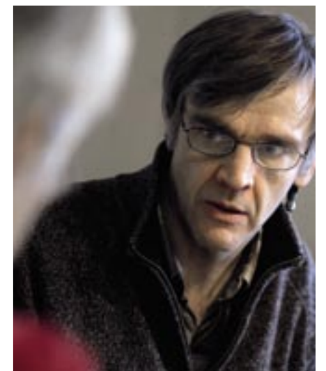
Hembesöken har högsta prioritet.