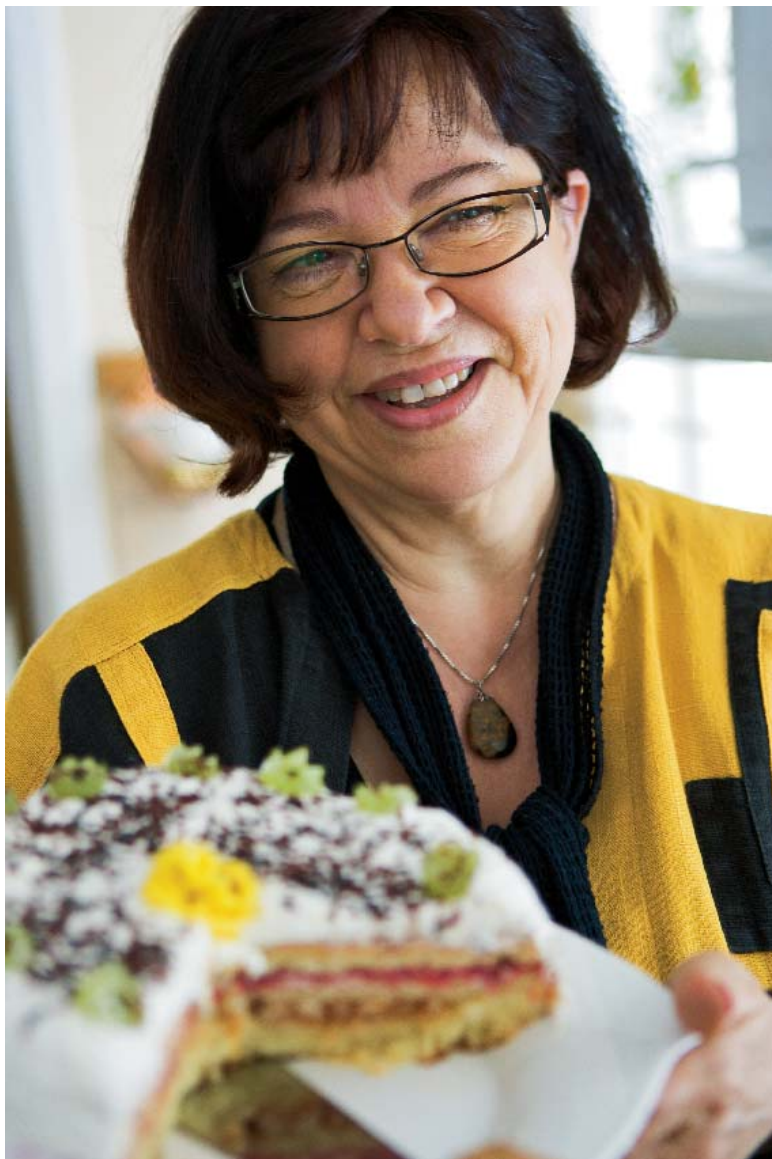
Nyfirad. Nyss fyllda 58. Födelsedagstårten är bakad av maken.

Dels är det tonerna, två separata, dels är det ett knaster som av aluminiumfolie, och så därtill ett ljud som av en stillastående lastbil som gasar om igen. Samtidigt som lättningen över att få hjälp av hörapparaterna var stor så kunde hon känna en sorg över att tinnitus inte går att avhjälpa på samma sätt.