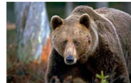
Respektingivande. Tänk att möta en sådan bjässe i skogen!

Gång på gång gick han tillbaka till hörselvården. – Det var helt hopplöst. De skulle bestämma vilken sort jag skulle ha och hur de skulle ställas in. Landstinget levererar hörapparater, men struntar i om de fungerar, säger han kritiskt.