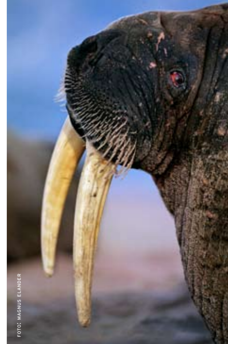
På bettet. valrossen använder sina betar både till anfall och försvar.

– Jag tycker det är viktigt att kunna justera volymen efter eget önskemål. När jag sitter och väntar ute i skogen vill jag ha dem på max.